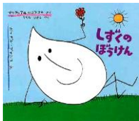
『しずくのぼうけん』