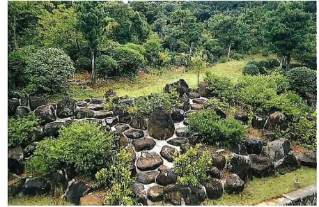
↑昭和41年頃 整備されたばかりの裏山