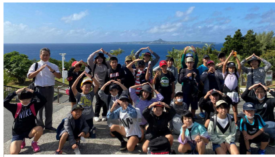
美ら海水族館（この後、暴風雨でした）

コロナの影響で伸びていた修学旅行がやっと実施されました。天気も大岳小学校を避けるように外での活動の時は晴れてくれました。美ら海水族館、PA体験、最終日は平和祈念資料館での平和学習と盛り沢山な内容でしたが集団行動を意識し最後まで仲良くたくさん思い出を作ることができました。