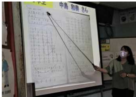
ノート紹介 (高学年)

宿題朝会では、宿題のやり方や目標冊数の説明の後、模範となるような良いがんばりノートを各学年から1名ずつ挙げてもらい担任の先生からみんなに紹介しました。紹介されたがんばりノートを参考に大岳っ子全員のレベルが上がっていくことを期待します。