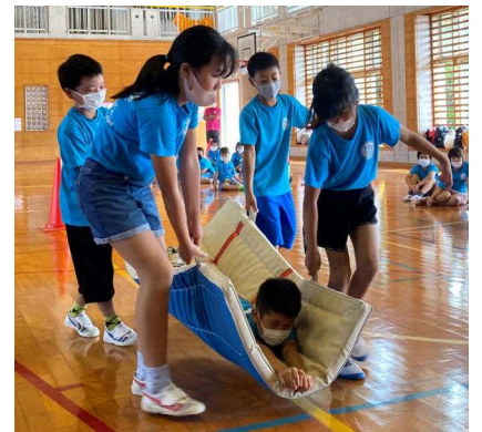
↑空飛ぶじゅうたん